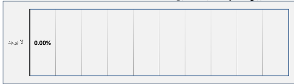
ك التوزيع القطاعي لاستثمارات الصندوق