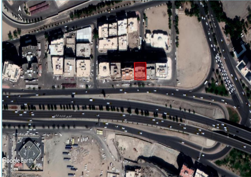
صورة توضح حدود العقار