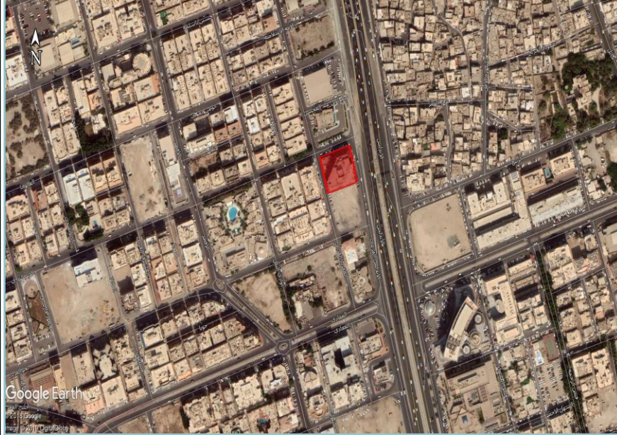
صورة توضح حدود العقار