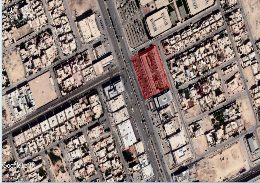
صورة توضح حدود العقار